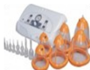
Vacuum Terapia Profesional. Infrarrojo