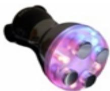
Mesoterapia Virtual. Electroporador portátil