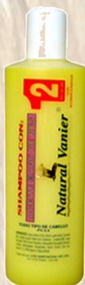
Shampo Mano de res Ref 0052 Todo tipo cabello con acondicionador. Frasco de 500 Ml