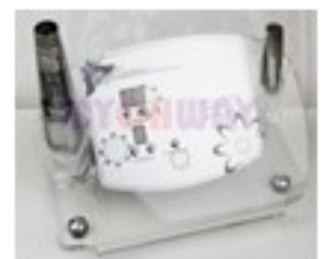
Mesoterapia Virtual. Electroporador