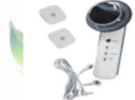
Ultrasonido 1 Mhz 3 en 1 Infrarrojo-Gym