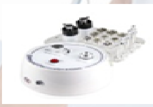
Microdermabrasion 3 en 1