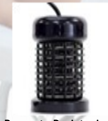
Repuesto Desintoxicador Array (Electrodo)