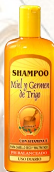
Shampo Miel y germen de trigo Ref 0054 Cabello seco y maltratado con acondicionador. Frasco 500 Ml