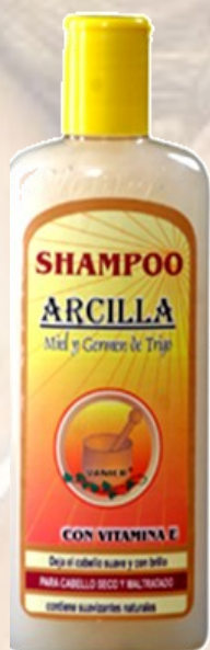
Shampo de Arcilla Ref 0053 Todo tipo de cabello con acondicionador Frasco de 500 Ml