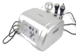
Ultracavitación Portátil 3 en 1 NV-21