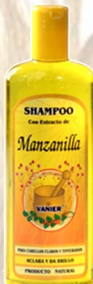
Shampo Manzanilla. Ref 0057 Cabello rubios y claros. con acondicionador. Frasco de 500 Ml