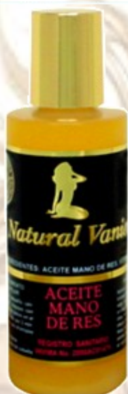
Aceite Mano de res Ref 0035 Tratamiento capilar proporciona brillo, reafirmante busto y para piernas delgadas Frasco por 120 Ml