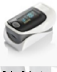
Pulso Oximetro. NV-30