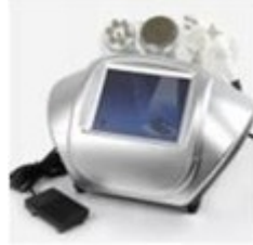
Ultracavitación 5 en 1 RU6