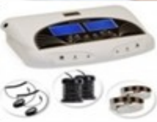
Desintoxicador Ionico Dual con Faja