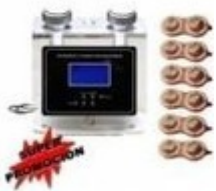
Ultracavitación con infrarrojos NV-11