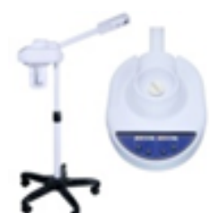
Vapor Ozono Profesional Pedestal