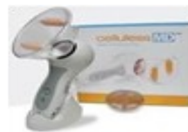
Cellulose MD NV-29