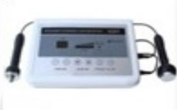
Ultrasonido 1Mhz 2 cabezales