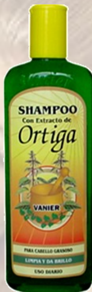
Shampo de Ortiga Ref 0055 Cabello graso con acondicionador. Frasco de 500 Ml