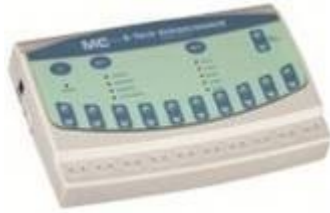
Gimnasia Pasiva NV-07