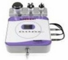
Cavitación con Rf. Tripolar/Facial/Corporal