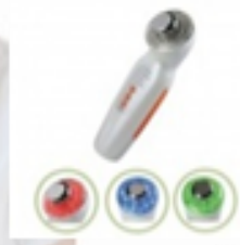
Ultrasonido Portátil. 3 Mhz