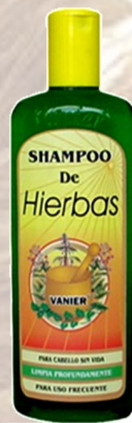
Shampo de Hierbas Ref 0074 Para todo tipo de cabello, suavizante e hidratante con acondicionador Frasco de 500 Ml