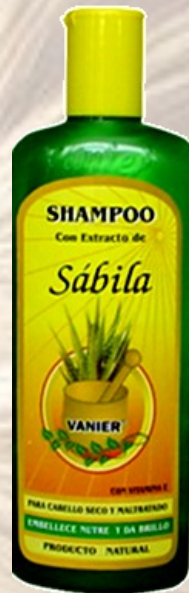
Shampo de Sábila Ref 0056 Cabello seco y maltratado con acondicionador. Frasco de 500 Ml