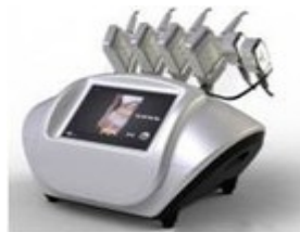
Lipolisis Laser Profesional