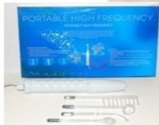
Alta Frecuencia NV-24