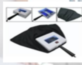
Lampara de Wood NV-37