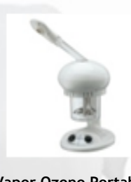
Vapor Ozono Portable