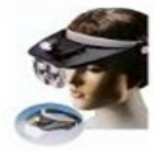
Lupa Facial de Portable