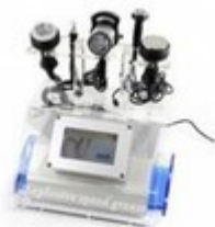
Lipolisis Laser. Profesional