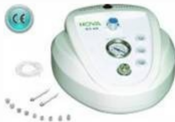
Microdermabrasion Profesional. NV-22